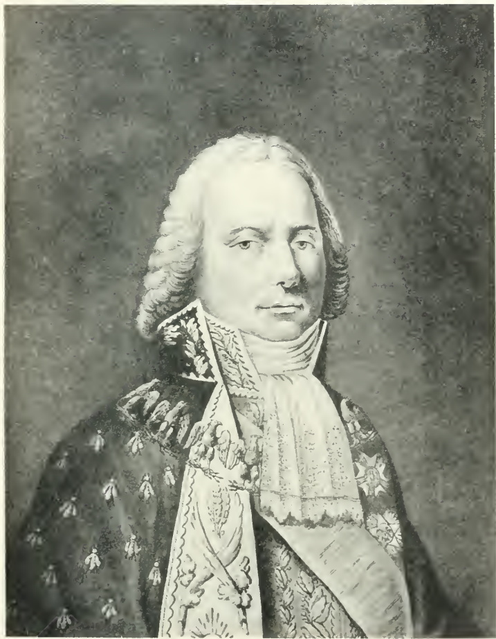
LE PRINCE DE BÉNÉVENT, GRAND CHAMBELLAN